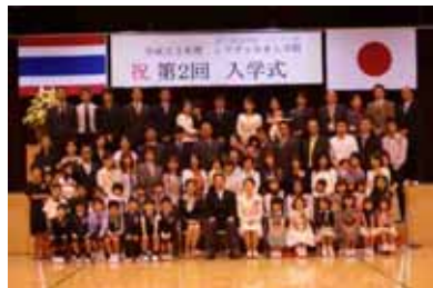
小学部25名の新入生と保護者のみなさん

さて、開校2年目の今年度は真価が問われる年と認識しております。泰日協会学校シラチャ校がさらに成熟できるよう、「世界一の日本人学校」に飛躍できるよう、我々職員も一致団結して教育活動にあたりますので、保護者の皆様のご理解とご協力を、今年もよろしくお願い致します。