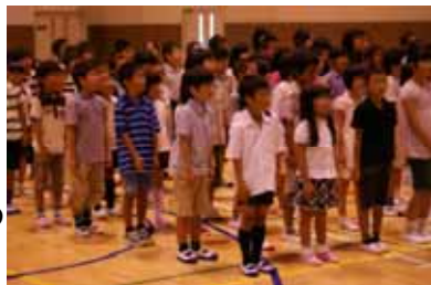
もえる太陽〜♪ 元朝に校歌を歌っています。

21日に行われた入学式にはたくさんのご来賓と保護者の方々にご列席いただきました。あたたかい雰囲気の中で新入生を迎えることができましたことにこの場をお借りしてお礼申し上げます。ありがとうございました。