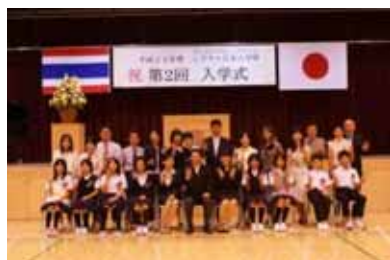
中学部8名の新入生と保護者のみなさん