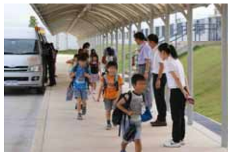
元朝にあいさつをかわします

開校2年目を迎えたシラチャ日本人学校。「朝のあいさつ」が、いつまでも良き伝統として受け継がれて欲しいと思っています。