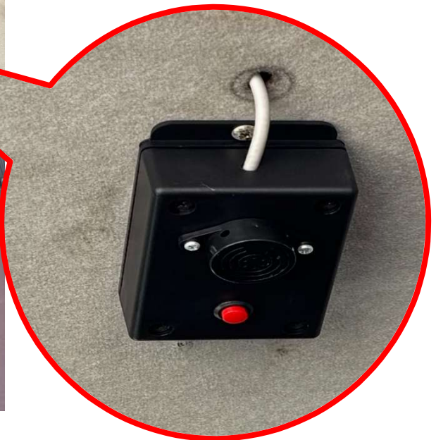
置き去り防止アラーム